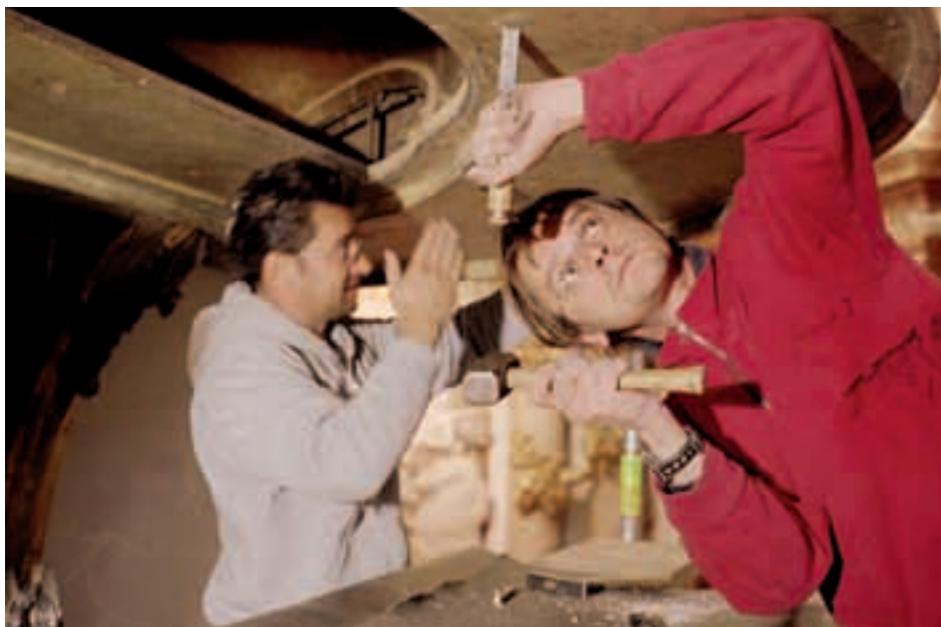
Spannender Moment. Die Verankerungen werden gelöst.