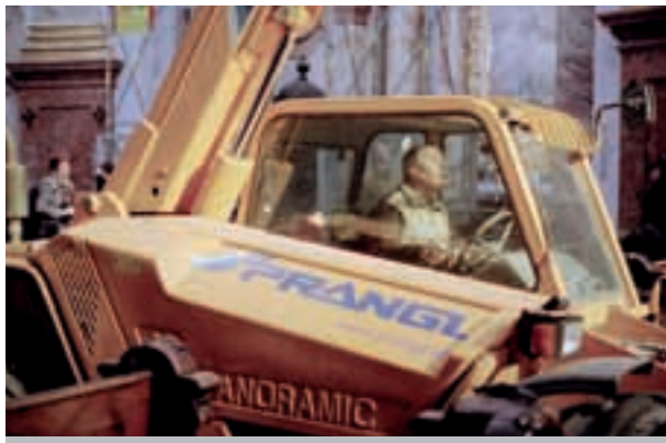
Millimeterarbeit im Kirchenschiff.