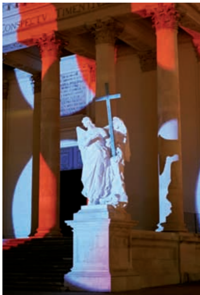
Spektakel. Hunderte Besucher waren fasziniert.