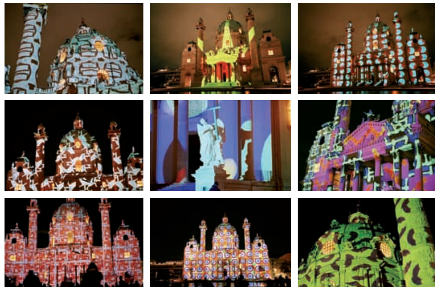
Neue Perspektiven. Die ehrwürdige Karlskirche einmal mehr ein einzigartiges Kunstwerk.