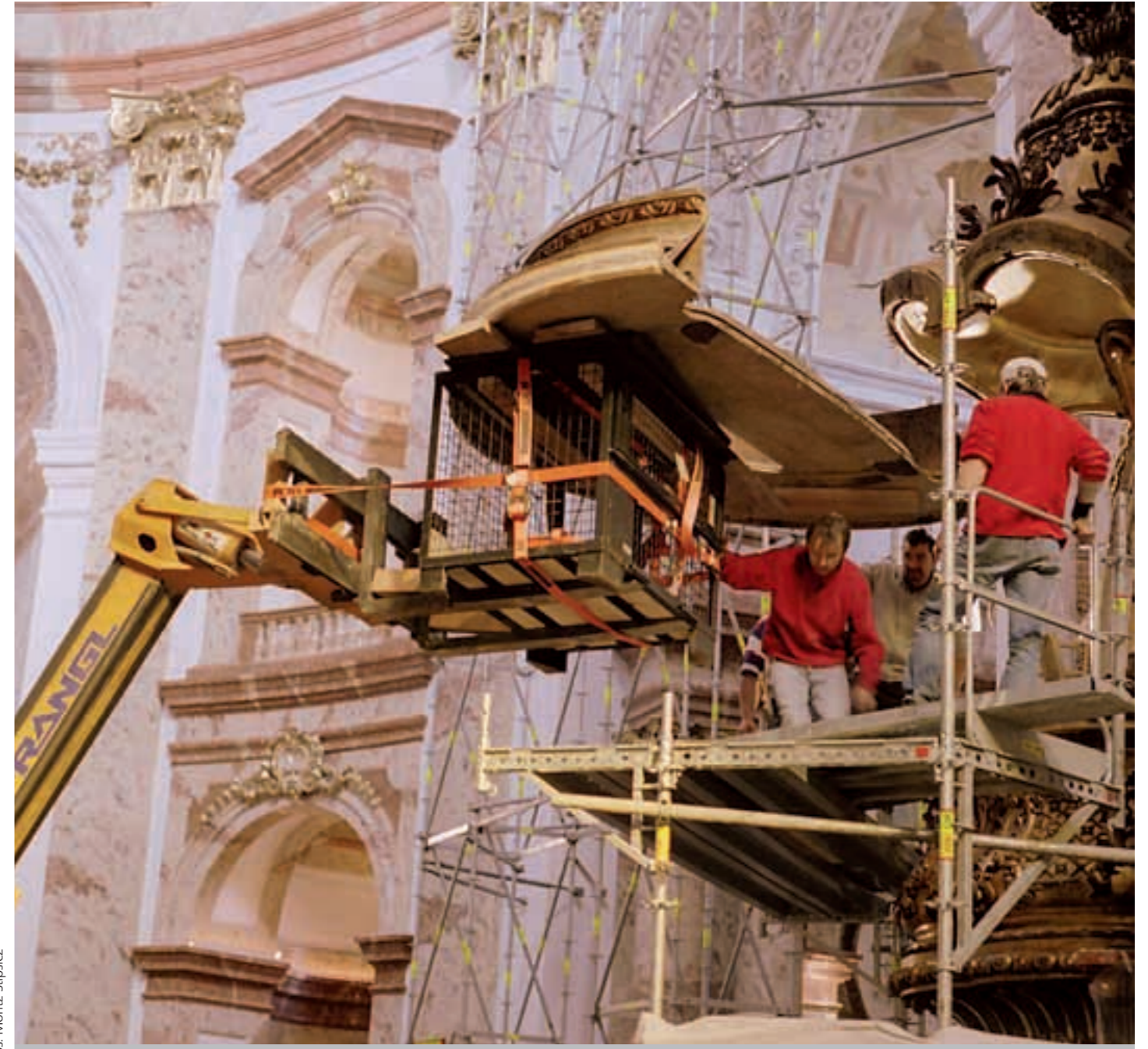
Der Moment, auf den alle gewartet haben: Nach fast 150 Jahren wird die Originalgestaltung der Kanzel sichtbar.