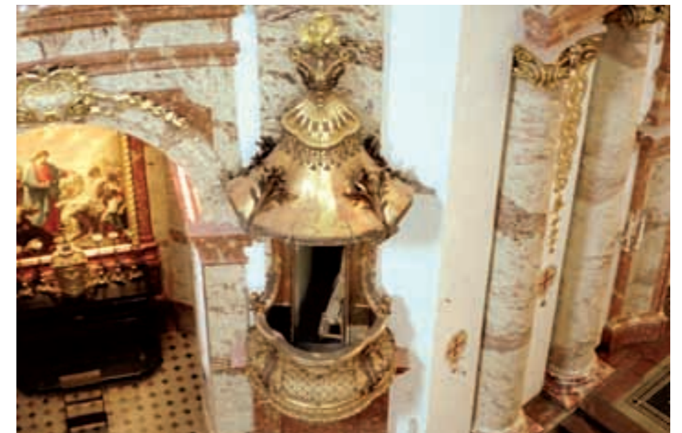
5 Stunden später. Die Kanzel – nun wieder befreit von störenden Zutaten.