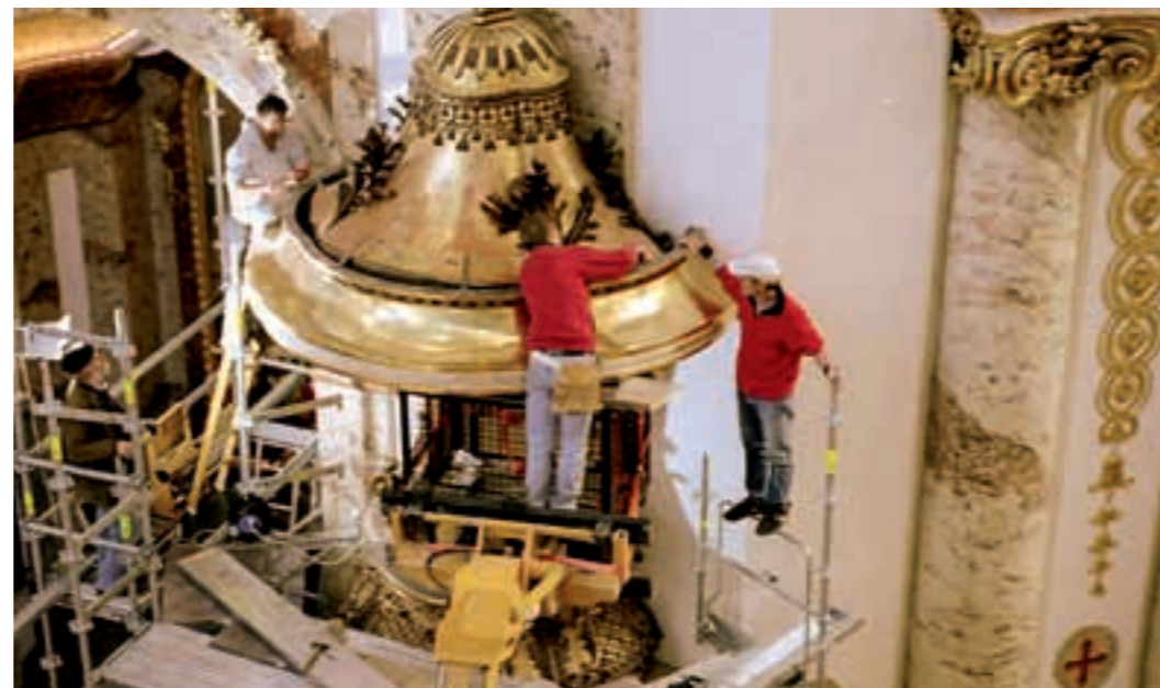
Demontagarbeiten in luftiger Höhe.