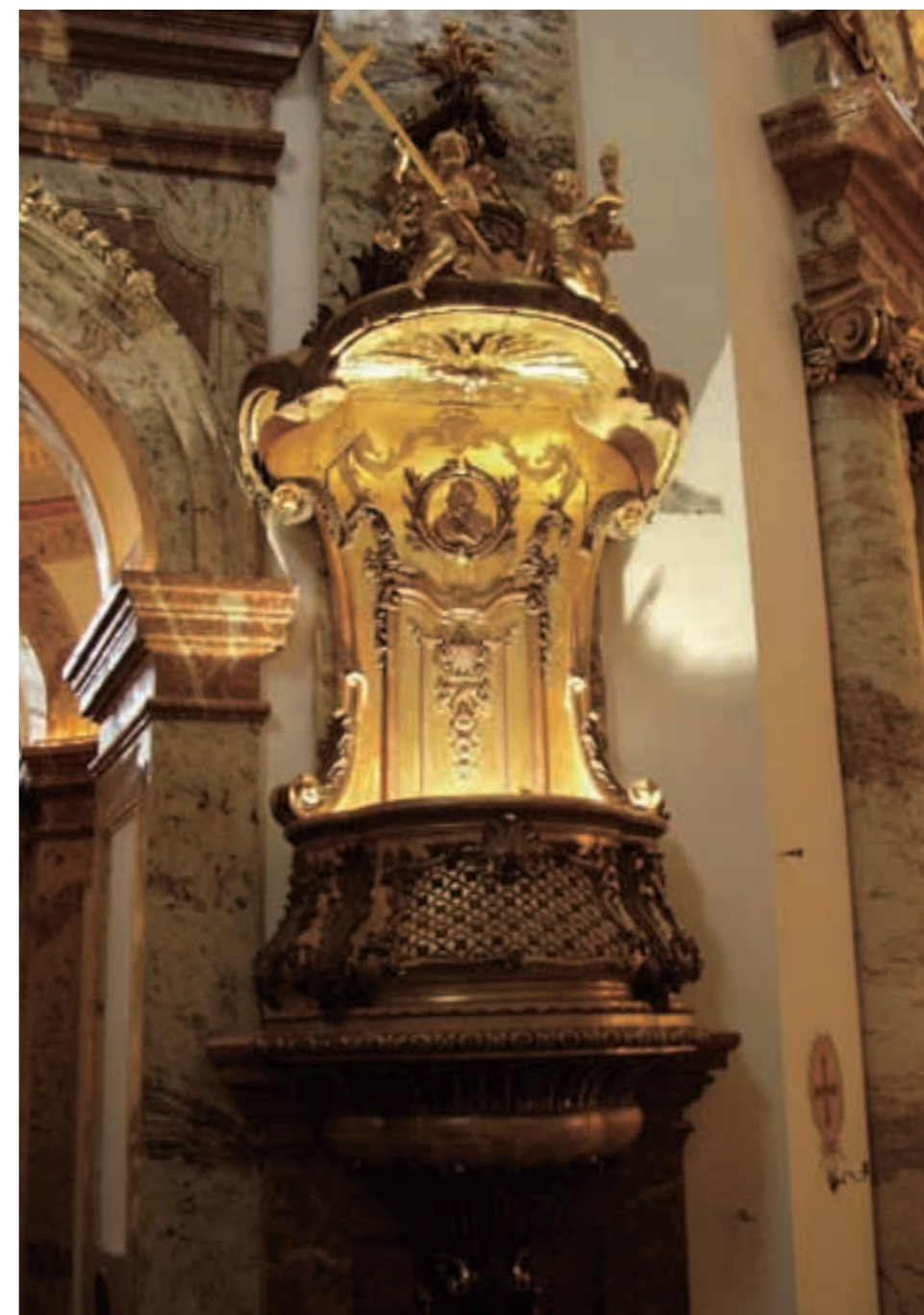
Die Kanzel nun wieder in der von Fischer von Erlach erdachten Linienführung.

Die Arbeiten an der Wiederherstellung der Kanzel sind in vollem Gange. Noch ist der endgültige Zustand nicht erreicht. Unser Restaurator Herr Kratochwill und sein Team sind derzeit emsig dabei, die Schäden der vergangenen fast 300 Jahre zu beheben. Die gesamte Vergoldung wird nachgebessert, Teile der kunstvollen, aus edlem Nussholz gefertigten Schnitzereien werden ergänzt. Aus den erhaltenen Schnitzelementen werden diese Ergänzungen rekonstruiert. Das harte Nussholz, aus dem Blattfiguren und Ornamente geschnitzt werden, ist nicht nur Widerstand für den Schnitzer, sondern Garantie für die Widerstandsfähigkeit der Ornamente gegen Alterung. •